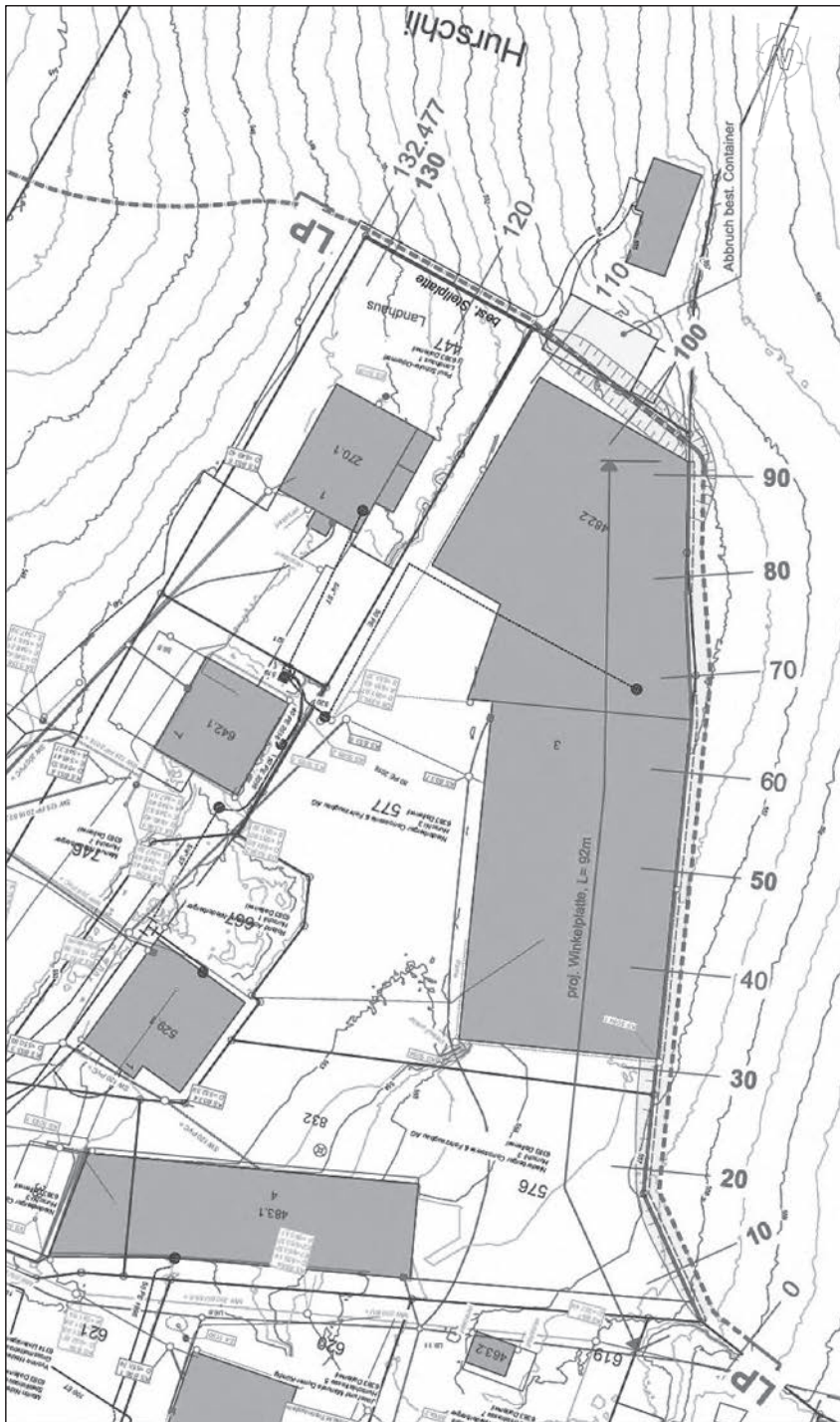
Das von Westen kommende Oberflächenwasser wird südlich mittels Winkelementen um die Parzelle 576/577 geleitet.